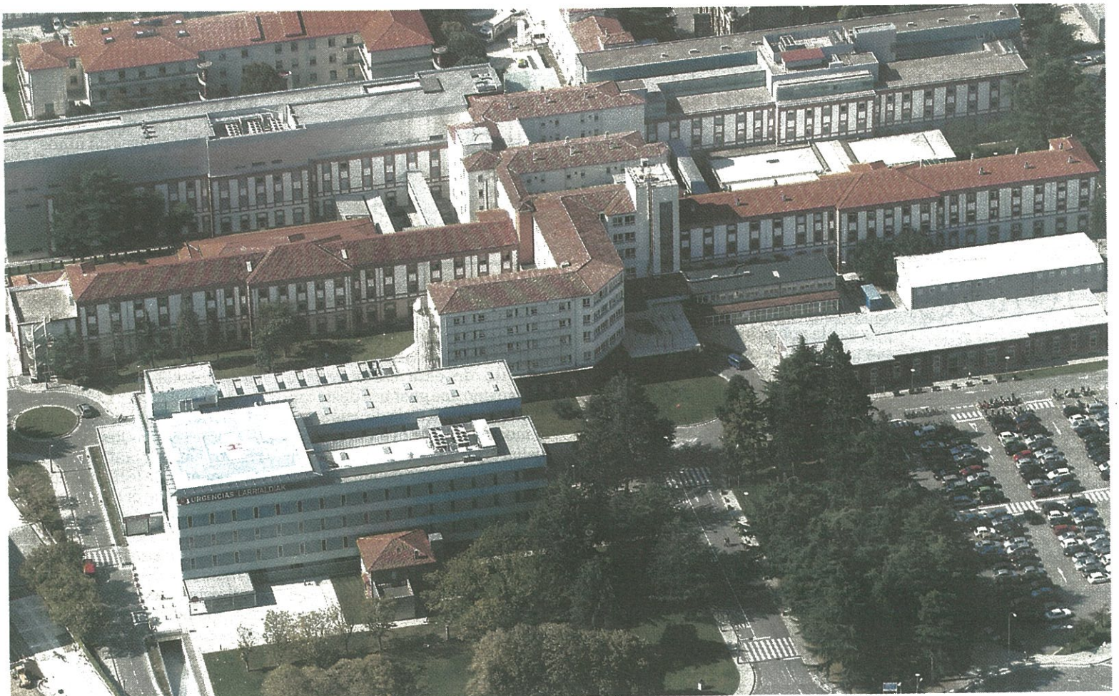
Imagen del Complejo Hospitalario de Navarra.