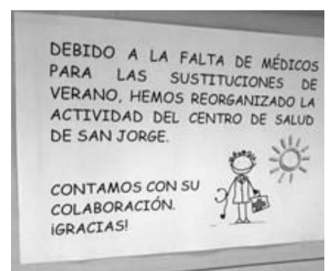
Cartel que se colgó en San Jorge.

En este sentido cabe resaltar que la última OPE propuesta en 2017 sólo contemplaba 15 plazas para médicos aunque el año anterior salieron 133 plazas para distintas especialidades cuyos procesos es-