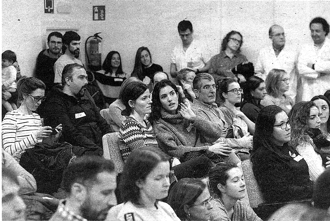
Médicos reunidos en asamblea durante la jornada de huelga del miércoles 30.