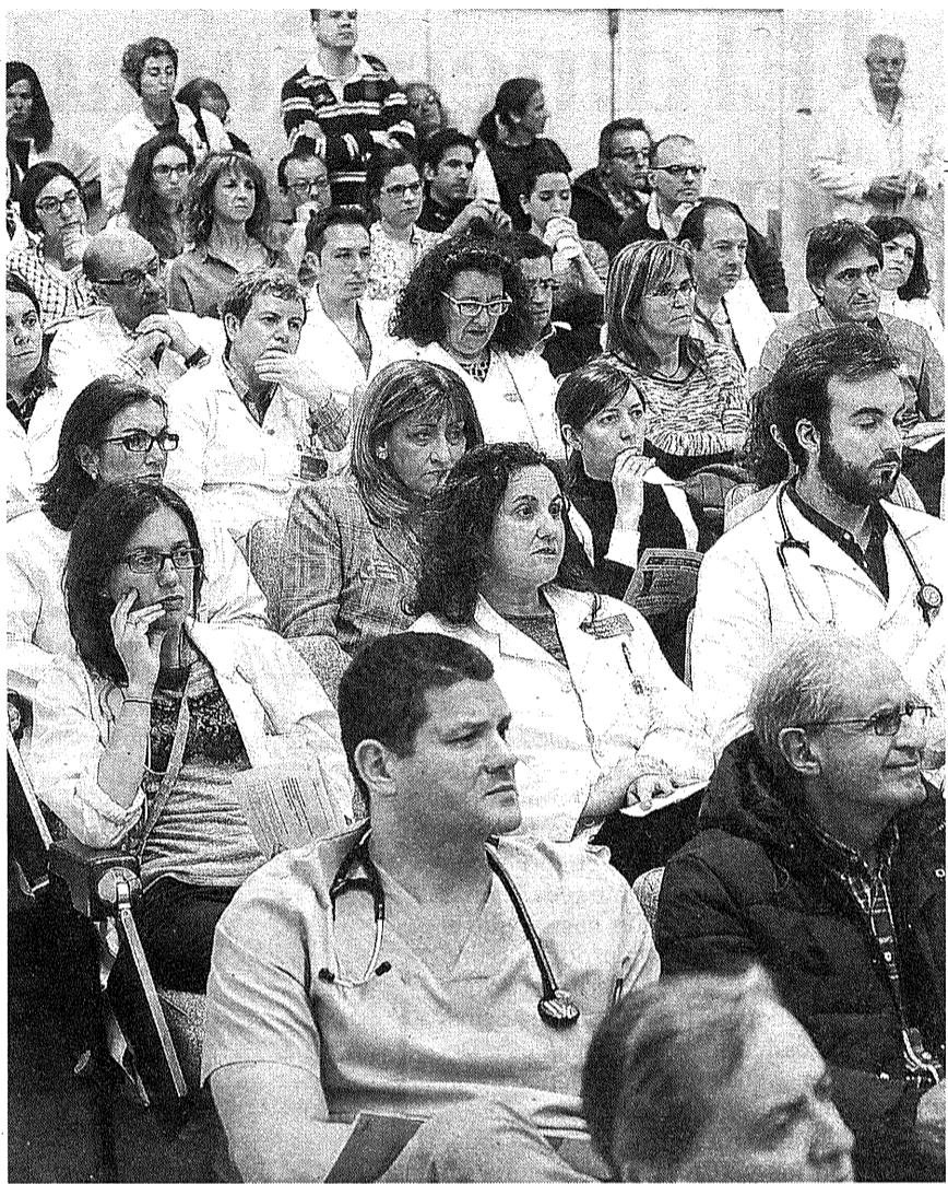
Facultativos asistentes a la asamblea del SMN ayer en Pamplona.