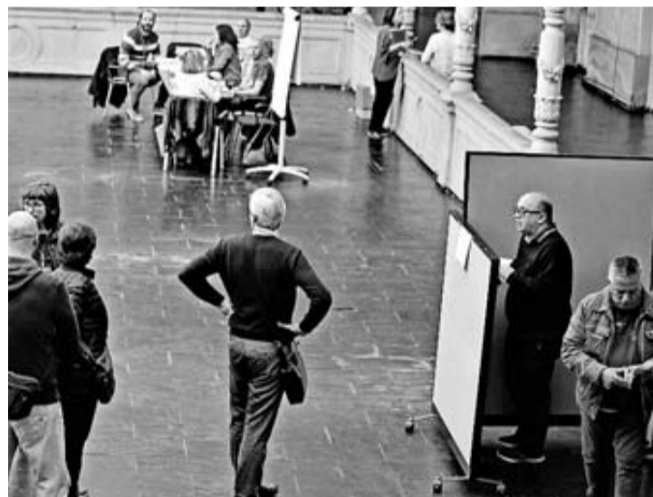
Los resultados de Salud no se conocieron hasta la madrugada. CALLEJA

De los 27.105 trabajadores llamados a las urnas, finalmente votaron 14.489, un 53,45% del censo. Además de las elecciones en Policía Foral, con 1.070 electores y 23 representantes en juego, quedan pendientes de celebrar las del personal laboral del Servicio Navarro de Salud, que votarán el año que viene para elegir a sus 13 representantes.