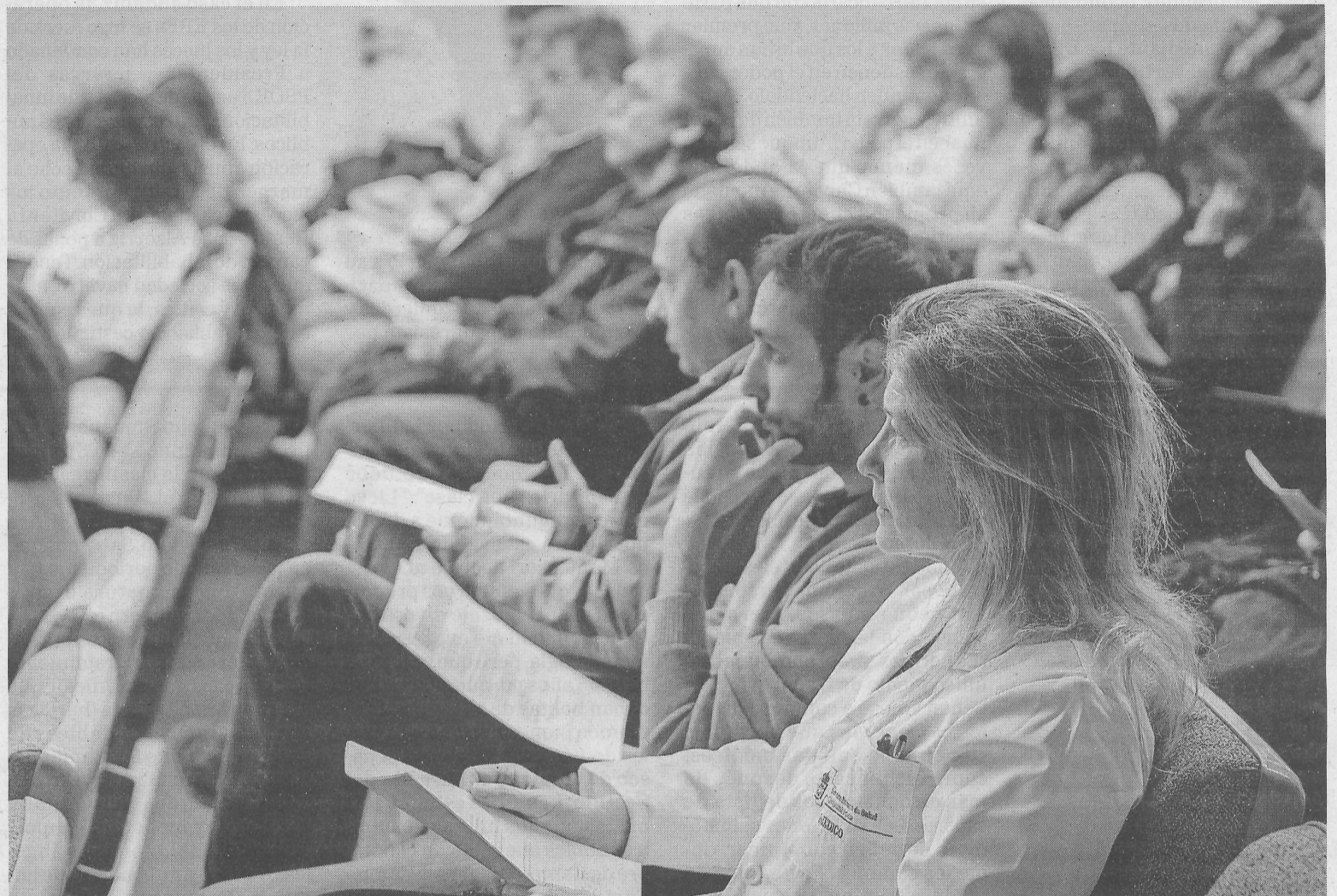
Varios médicos antes de comenzar la asamblea del pasado viernes en el Complejo Hospitalario de Navarra.

El conflicto se inició públicamente en enero, con una jornada