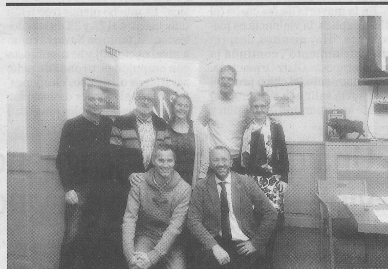
Integrantes de la junta de la Sociedad Navarra de Geriatria.

4 Revisar la normativa sobre horas extras y primar guardias en días especiales (24, 25 y 31 de diciembre y 1 de enero).