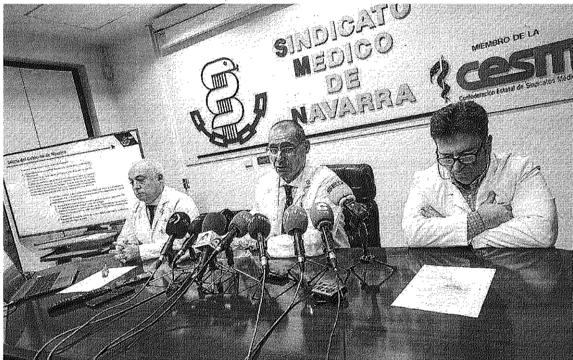
Los representantes del Sindicato Médico, ayer en rueda de prensa.

● Otras medidas. En el ámbito retributivo la incorporación de la carrera profesional para todo el personal contratado facultativo y diplomado sanitario. Para la sobrecarga laboral, plantea reforzar la Atención Primaria con médicos jubilados y ofreciendo contratos a quienes acaban este año el MIR.