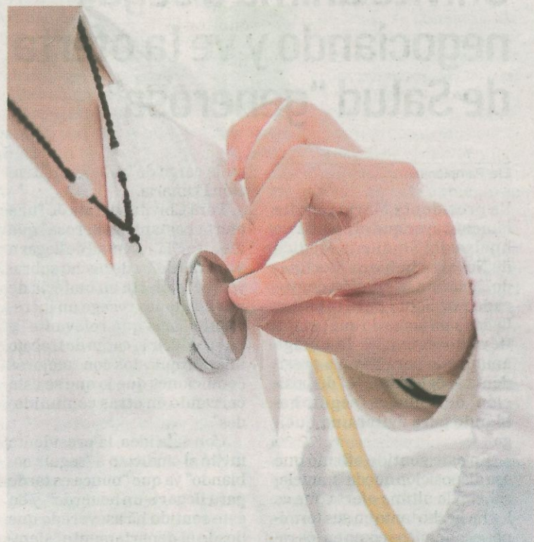
Una paciente en el momento de una exploración médica.

Se garantiza la actividad para pacientes que reciban tratamientos pautados. También la continuidad de la asistencia en pacientes ingresados en los hospitales y la atención en urgencias.