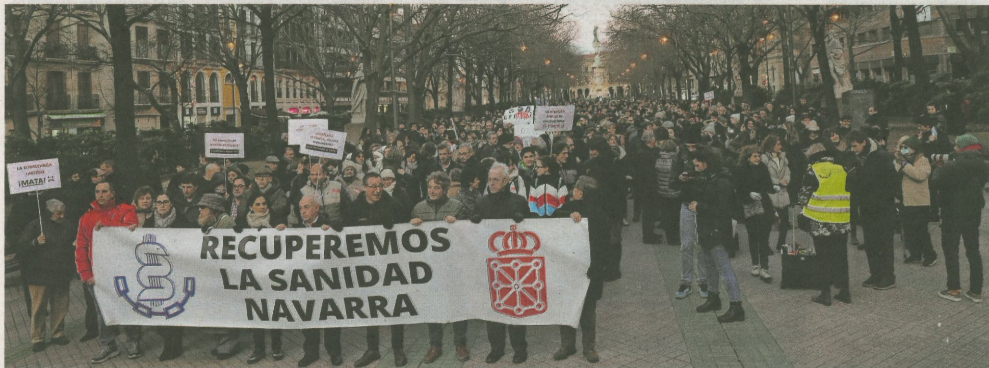
Los asistentes recorrieron a pie el Paseo de Sarasate con lemas a favor de la sanidad navarra y en favor de unas condiciones laborales dignas.

■ ¿Se acuerda usted de lo que hizo el 20 de octubre del año pasado? ¿A que no? Normal, ha pasado mucho tiempo, exactamente 101 días. Casi nada. Pues ese 20 de octubre de 2022 el Sindicato Médico de Navarra convocó la huelga indefinida que hoy comienza. Lo hizo con margen suficiente para que la patronal (el Gobierno de Navarra) planteara una negociación. En estos 101 días no solo no se ha llegado a ningún acuerdo, es que han dejado para el final las ofertas y las contraofertas. Typical spanish: lo dejamos todo para el último día. El problema es que hoy esta desidia va a suponer que alguien, con más o menos gravedad, deje de ser atendido a pesar de tener concertada una cita. Y si se descuidan, la cita se la dieron antes de octubre del año pasado.