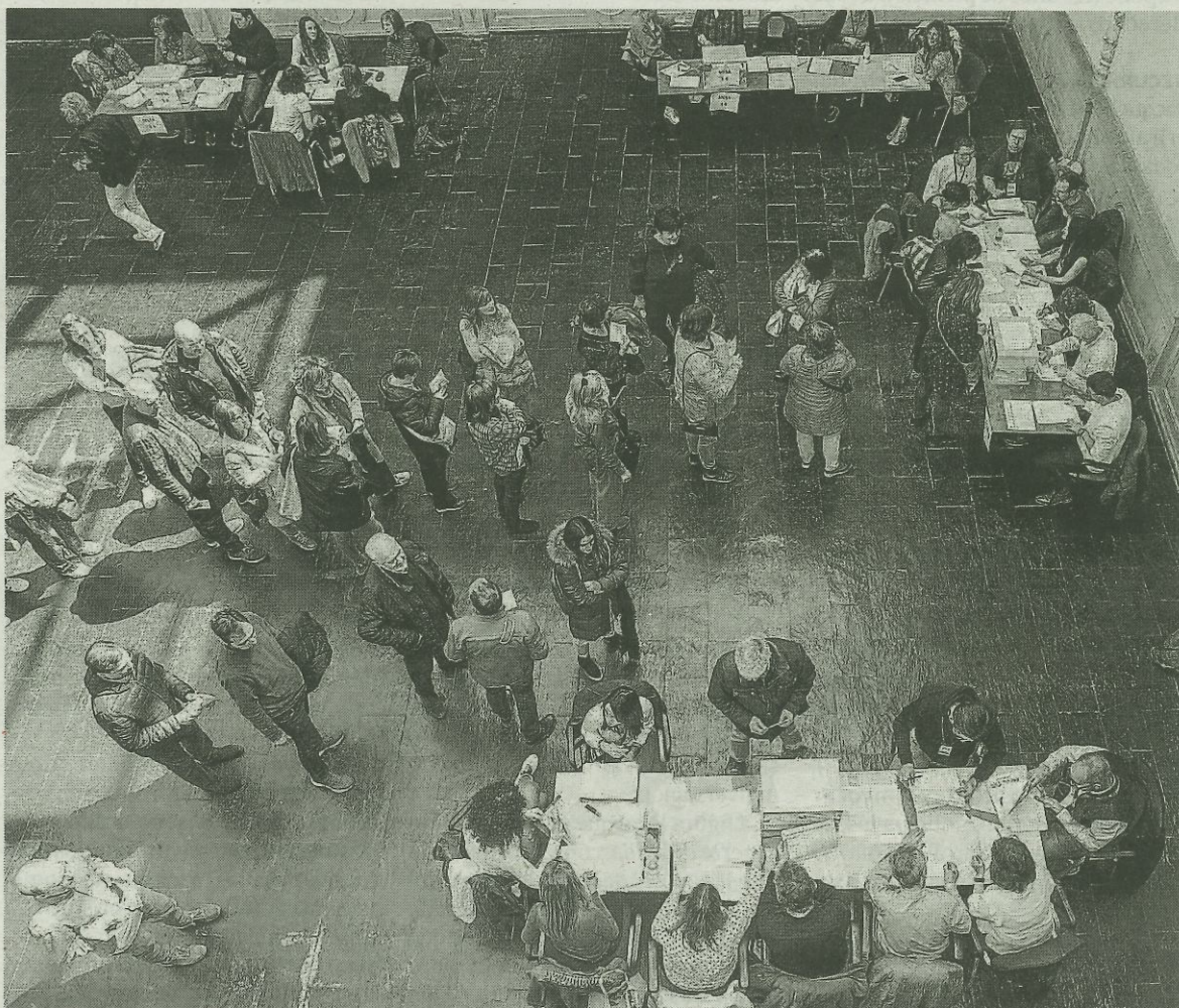
Electores durante la jornada de votación en las mesas del Instituto Navarro de Administración Pública.

CCOO arrancaba estas elecciones como segunda fuerza y aspiraba a conservar sus 41 delegados a pesar de un contexto de más plantilla y más representantes a repartir. Pero tras estos resultados va a quedar relegado a la tercera posición, se queda en 36.