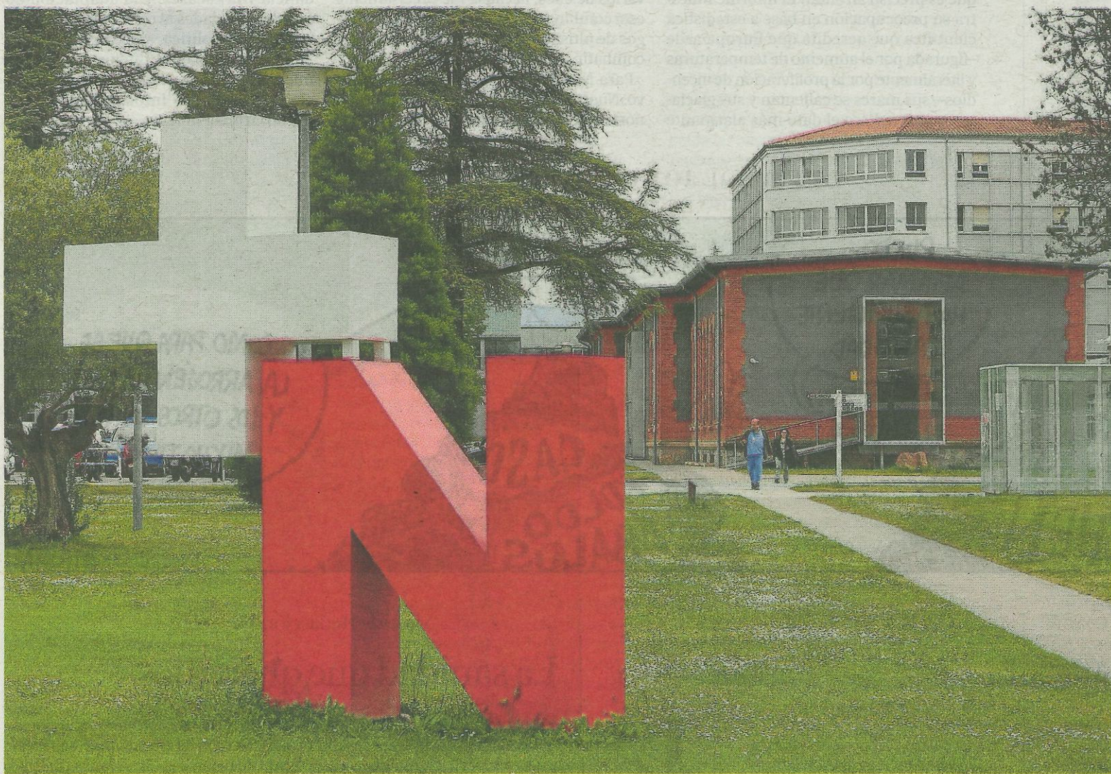
Exterior del Hospital Universitario de Navarra (HUN).