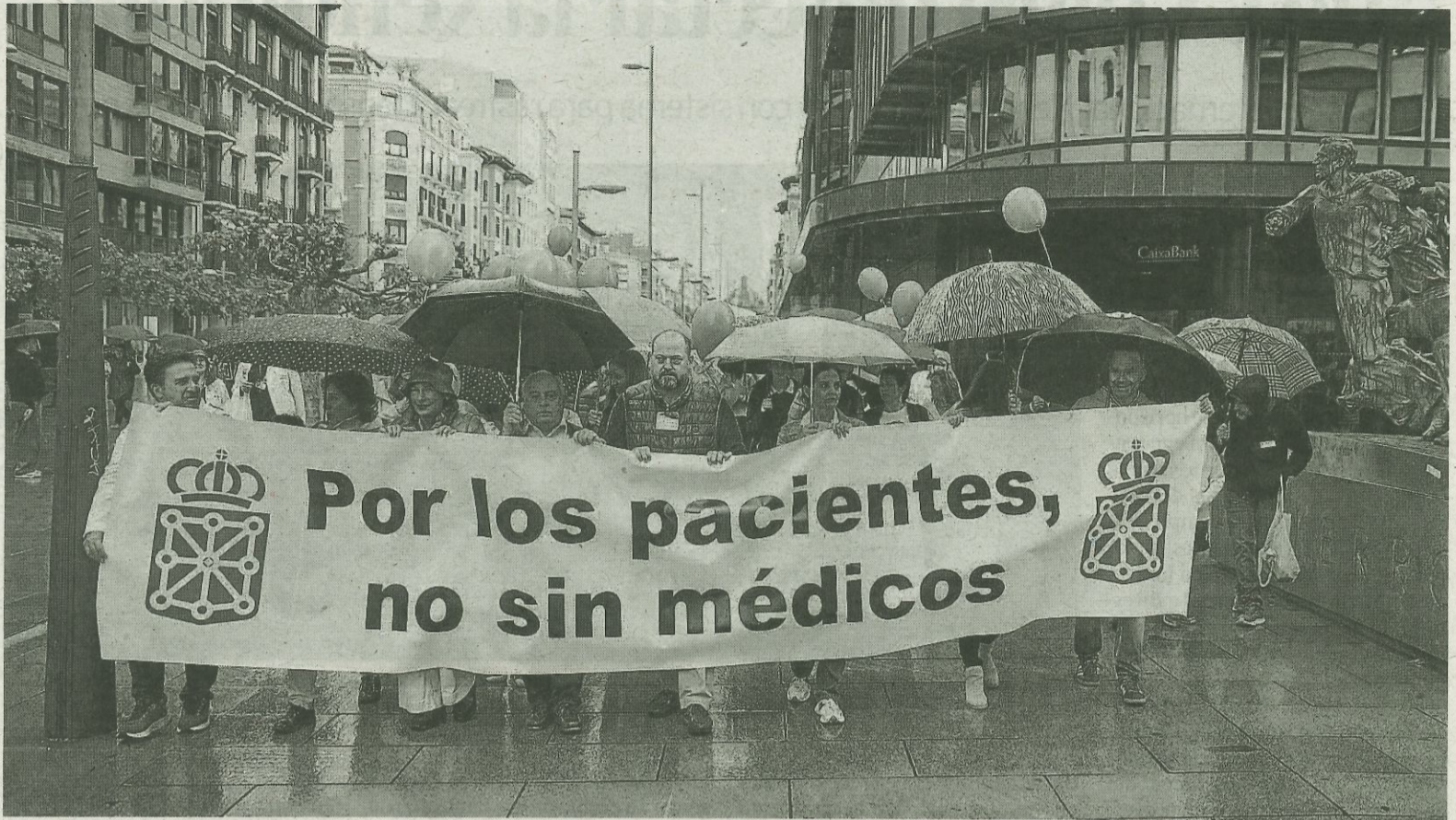
Miembros del Sindicato de Médicos, con la pancarta que daba inicio a la marcha por las calles de Pamplona.

●●● Mensajes en el móvil. El Servicio Navarro de Salud-Osasunbidea (SNS-O) ha comenzado a anular citas a pacientes que tenían programadas sus consultas para las próximas semanas como consecuencia de la negativa de los médicos a realizar horas extraordinarias. Los pacientes afectados han empezado a recibir mensajes de texto en sus móviles en los que se les informa de la cancelación de las citas previstas. En las comunicaciones se les indica la posibilidad de obtener más información llamando al teléfono 848422020, del Centro de Especialidades Príncipe de Viana. Según el testimonio de algunos de los pacientes contactados, Salud no aporta las causas de la cancelación de las citas a los propios afectados, que llevan semanas esperando una consulta. — J.M.