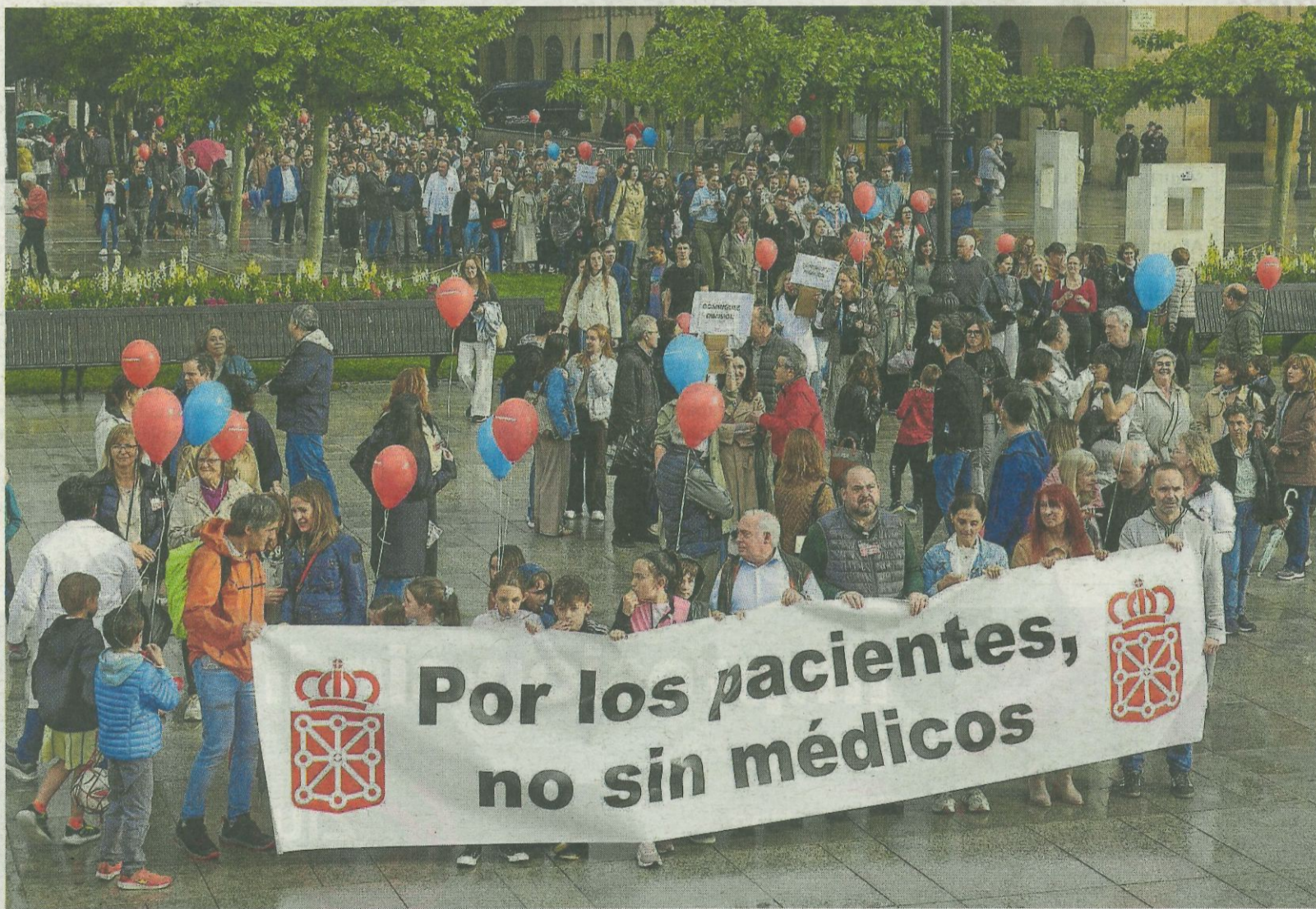
“Queremos una negociación de verdad con el Departamento de Salud y con el Gobierno de Navarra”, destacaron los médicos.