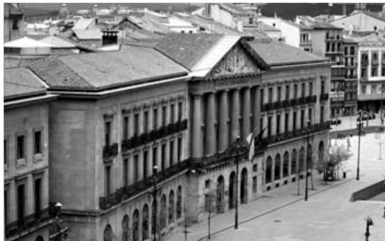
Vista del Palacio de Navarra en Pamplona, sede del Gobierno.

El actual Gobierno de Yolanda Barcina (coaligado con el PSN el primer año) no ha aprobado una sola oferta pública de empleo de calado (OPE) en toda la legislatura, a excepción de 20 técnicos en Hacienda a finales del año pasado. Las oposiciones de Enfermería celebradas en 2012, corresponden a una OPE aprobada por el Gobierno anterior, en 2009. Y las 172 nuevas funcionarias todavía no han tomado posesión de la plaza, porque los procesos de ad-