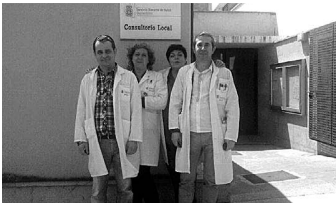
En las tres imágenes sanitarios de Murchante, Cintruénigo o Cabanillas que salieron a la calle el viernes junto a compañeros de Corella, Valtierra, Cascante, Azagra, Ribaforada, Cortes, Allo, Cadreita para protestar por la reforma de las urgencias rurales implantada por Salud.