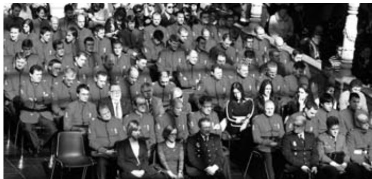
Policías forales en su última celebración del Día de la Policía Foral. CALLEJA

La plantilla se reduce un 3,1% Las medidas impulsadas desde