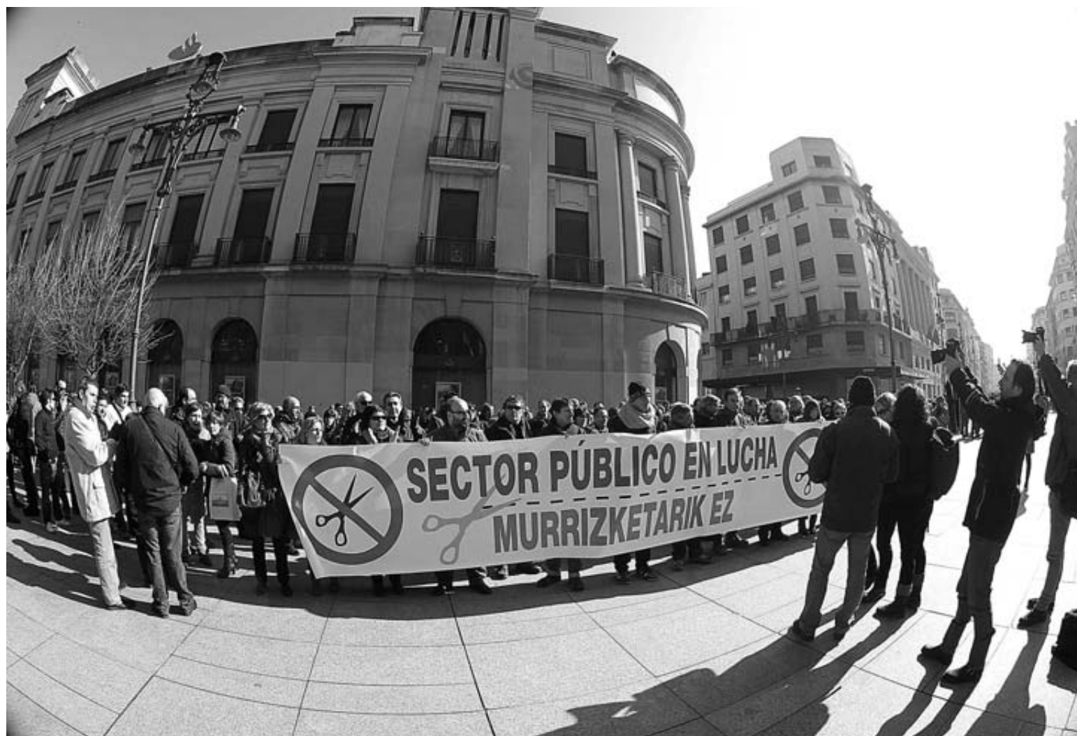
Trabajadores del sector público en una de las numerosas concentraciones laborales del último año.

Al menos, este año los trabajadores recuperarán parte de ese poder adquisitivo perdido ya que, a pesar de que los salarios siguen recortados y congelados, se pagarán las 14 pagas estipuladas. Lo que todavía no se sabe es si se repescará la 'extra' pedida en 2012. A pesar de que la oposición aprobó esta semana en el Parlamento una Ley para que el Gobierno foral devuelva la paga este año, la intención del Ejecutivo es recurrir dicha Ley por considerar que va contra una nor-