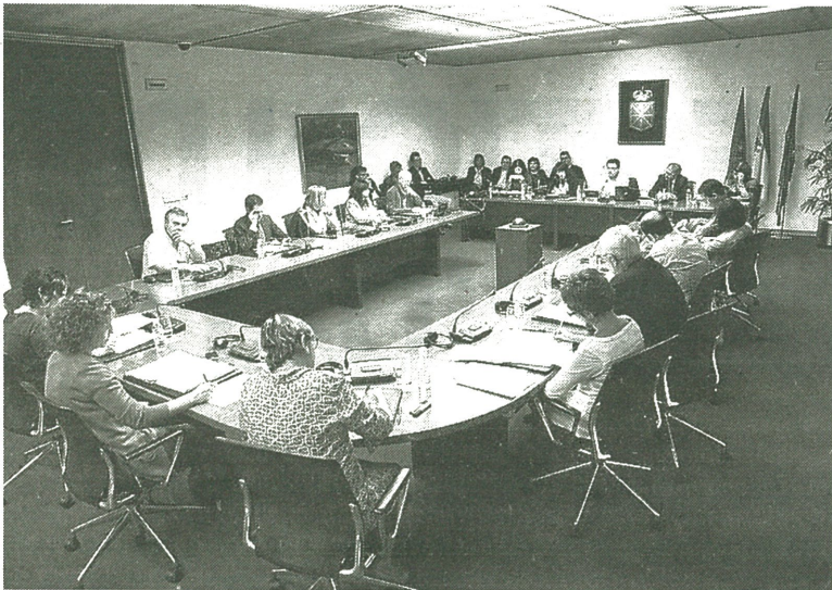
Doble jornada en la comisión de Salud del Parlamento.